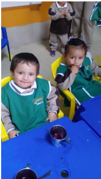
Infants gaudint de la "colada morada", una beguda tradicional equatoriana

l'atur o bé fan feines mal pagades). Amb la finalitat d'oferir una educació integral per a tots els nens i nenes i no excloure ningú, el centre busca recursos en forma de beques per a aquelles famílies que no poden fer front a la formació dels seus fills. Ens va arribar aquesta sol·licitud i també, gràcies a Caritas de Barcelona, podran comptar amb aquesta ajuda.