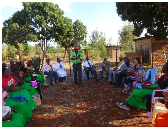
Moment en què els diversos testimonis van participar

En resum, aquell dia i tots els dies que vam estar al poble, les paraules que sentíem eren "MOLTES GRÀCIES! QUE DÉU US BENEIXI!".