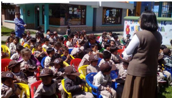
Classe a l'aire lliure