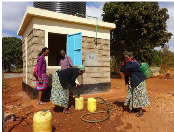
Recollida d'aigua al nou pou

Com és tradició en cultures com la kenyata, quan té lloc un esdeveniment important, es planta un arbre. Així, doncs, el dia de la inauguració es van plantar diversos arbres en el mateix terreny on hi ha el pou. D'aquesta manera, a mesura que vagin creixent, recordaran als habitants de Kithunthi els anys que té aquest pou que els ha canviat la vida!